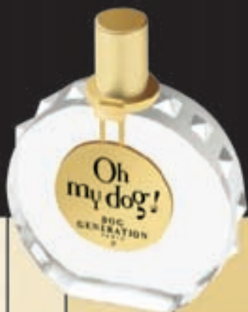
Eau de toilette - Dog fragrance