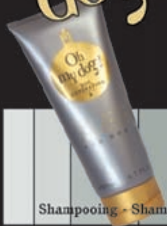
Shampooing - Shampoo