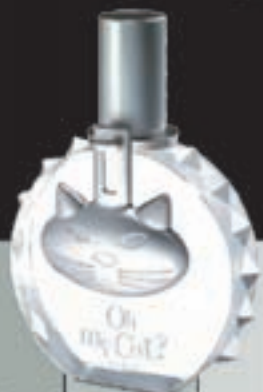
Eau de toilette - Cat fragrance